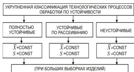
Рис. 1. Укрупненная классификация технологических процессов обработки по устойчивости

По устойчивости технологические процессы можно разделить на полностью устойчивые, устойчивые по рассеиванию и неустойчивые (рис. 1) [4].